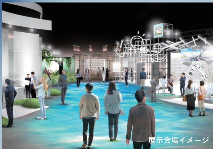
展示会場イメージ

展示を通じて、中小企業の持つ技術やアイデアに触れ、未来社会を実現する中小企業の魅力やその価値を世界へ向けて発信します。