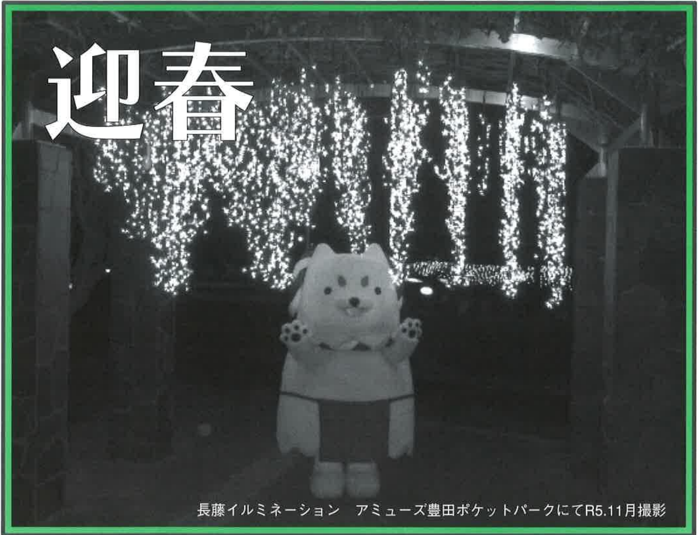
長藤イルミネーション アミューズ豊田ポケットパークにてR5.11月撮影

商工会は “行きます!” “聞きます!” “提案します!” そして “伴走します!”