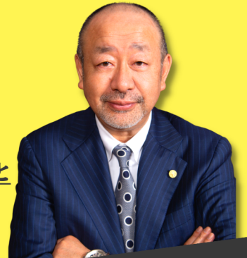
ビジネスモデルデザイナー