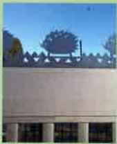
ツインビー(デザイン忍び返し)